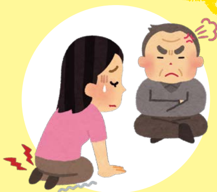
長時間ケアに対する 不満を言われる