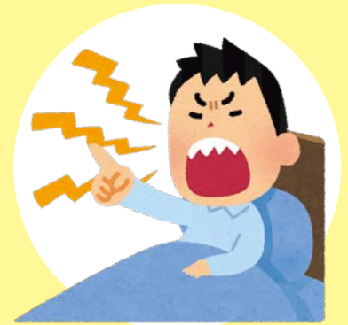
「2度と来るな」と 怒鳴られる