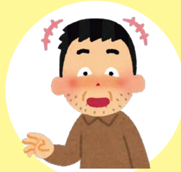
「胸が大きいね」と 言われる