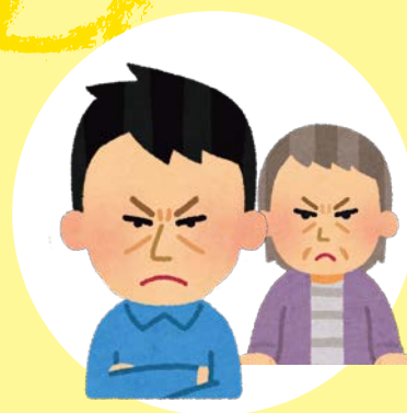
ニラみつけられる